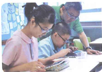
程志祥老師認為MySmartETextbook 對師生雙方來說都十分易學易用。