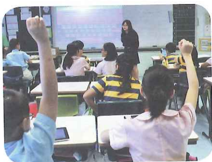
MySmartETextbook成功引起學生對英文的學習興趣，紛紛踴躍舉手回答問題，課堂氣氛活躍。