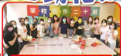
家長興趣班 — 卡通湯圓製作班