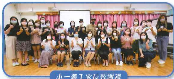
小一義工家長致謝禮